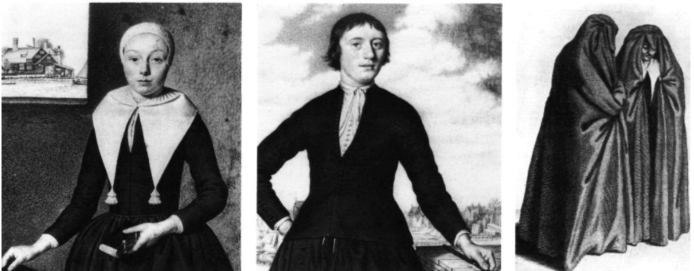
Kleding van vrouw en man aan het eind van de 17e eeuw, naar de tekeningen van J. Thopas, circa 1690. Uiterst rechts: rouwdracht in de Zaanstreek, 17e eeuw.

Wat bewaard is gebleven en in de diverse musea te aanschouwen is, betreft voornamelijk kleding van de rijkere burgers, gemaakt van dure stoffen zoals zijde en sifs. De Zaanlandsche Oudheidkamer bezit veel rokken en jakken van deze stoffen, doch slechts één rok (van omstreeks 1830) van een slechte kwaliteit katoen. In deze rok zitten maar liefst 38 verstelstukken. Toch mogen wij aannemen dat dit nog een 'mooie' rok was, anders zou zij niet bewaard gebleven zijn.