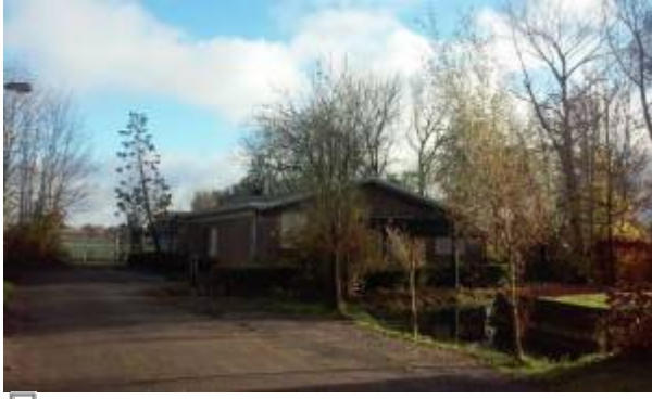
De onttakelde BB-Commandopost Middel 6, Westzaan gemeente Zaanstad.