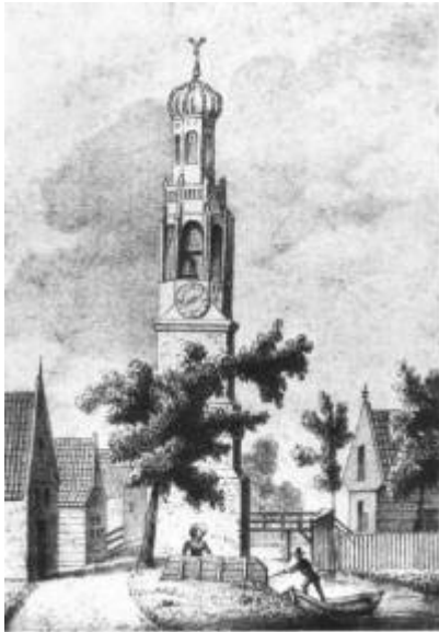
Beschuittoren, Wormer (uit: Zaanlandsch Jaarboekje)-

De Beschuitbakkerij werd uitgevoerd in kleinschalige bedrijven. Desondanks hadden Jisp en Wormer (begin 17e eeuw nog de grootste Zaanse dorpen) voor een groot deel hun welvaart aan deze nering te danken. Na de ondergang van de bedrijfstak halveerde de bevolkingsomvang van beide dorpen. De bloeiperiode van de beschuitbakkerij lag in de eerste decennia van de 17e eeuw. Volgens sommi ge bronnen waren er in 1620 niet minder dan 150 bakkerijen in de twee dorpen. Het volgende staatje (ontleend aan Sipke Lootsma ) lijkt betrouwbaarder: 1612: 66 bakkerijen; 1624: 84; 1638: 56; 1648: 83; 1697: 32; 1706: 23; 1714: 22; 1722: 14; 1759: 3. Het is aannemelijk dat in iedere bakkerij een bakker en één of twee knechts werkten. Het Wormerse en Jisper beschuit werd tot over de grens met ventschepen gedistribueerd. Hiervan zijn er maximaal zeventig in de vaart geweest.